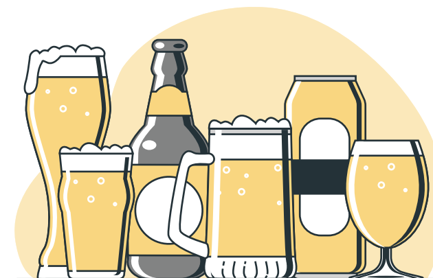
KOLIKRÁT SE TI V UPLYNULÉM ROCE STALO, ŽE JSI UŽIL/A: